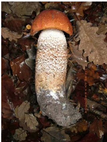
Eikeskrubb. Leccinum quercinum .

Hatten er nesten rund til hvelvet og 6-14 cm bred. Den er rustrød til mørkt teglrød, finskjellet og har overhengende hatthud. Rørlaget er først blekhvitt, senere rustrødt og blir rødgrått ved berøring. Stilken er 10-15 cm høy, 2 -3 1/5 cm tykk og sylindrisk. Den er ofte livlig rødbrunt skjullet eller grynet på lysere bunn. Kjøttet er hvitt og blir raskt vinrødt til mørkere grårødt. Mild lukt og smak. Sporene er 12-15 x 4-5 \mu m, blekbrune, glatte og spoleformete. Soppen er spiselig og god. Eikeskrubben vokser sommer og høst med eik og er mindre vanlig. Funnet nord til Hordaland.