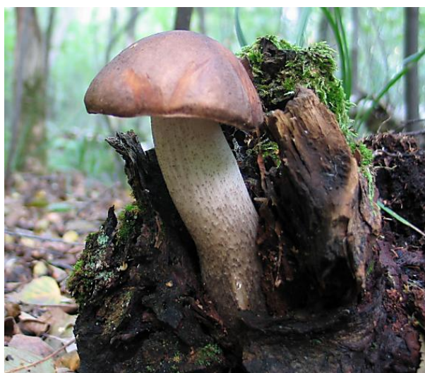
Heiskrubb. Leccinum cinnamomeum . 2 funn i Norge, Farsund i Vest Agder.

Hatten er konisk til klokkeformet eller hvelvet og 3-12 cm bred. Den er svarbrun til nesten svart og glatt. Rørlaget er hvitt til gulhvitt. Stilken er 6-12 cm høy, 1-3 cm tykk og avsmalnende oppover. Den er svartskjellete eller grynet på hvit bunn. Kjøttet er uforandrelig hvitt. Mild smak og lukt. Sporene er 15-21 x 5-7 \mu m, blekbrune, glatte og spoleformete. Soppen er spiselig. Sotskrubb vokser sommer og høst med bjørk i fuktig mark.