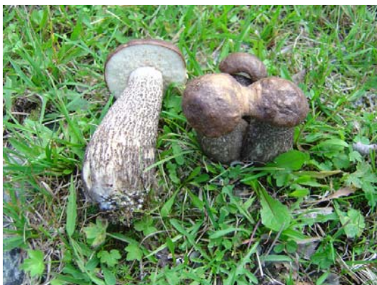
Svartskrubbe. Leccinum variicolor .

klebrig i fuktig vær. Fargen er mørkere eller lysere brun til gråbrun. Rørlaget er hvitt til gråhvitt og ikke sjelden rustflekke. Stilken er 10-20 cm høy, 1-3 cm tykk og sylindrisk og utvidet basis. Den er kledd med svarte gryn eller skjell på gråhvitt bunn. Kjøttet er uforanderlig hvitt. Mild og behagelig lukt og smak. Sporene er 14-20 x 5-6 \mu m, blekbrune, glatte og spoleformet. Soppen er spiselig og god. Brunskrubben vokser sommer og høst med bjørk i skog og mark. Den er vanlig i hele landet.