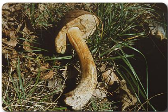
Rødnende brunskrubb. Leccinum roseofractum . 13 funn i Norge, Oppland og Sogn og Fjordane.