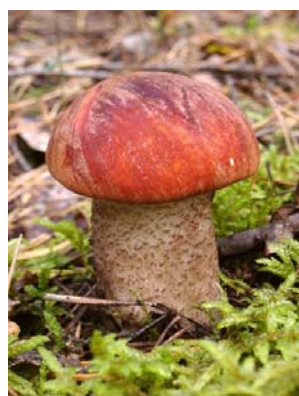
Ospeskrubb. Leccinum aurantiacum .

Hatten er halvkuleformet til hvelvet og 10-20 cm bred. Den er tørr, i fuktig vær noe klebrig, og rødbrun til vakkert oransje. Hatthuden er overhengende. Rørlaget er hvitt og blir grålilla ved berøring. Stilken