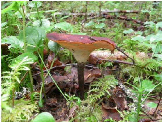
Trompetkjuke © A. Jahren